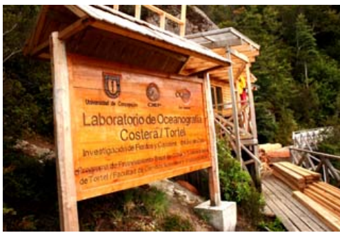
En la imagen: Laboratorio Oceanográfico de Tortel.

Desde hace unos años en Caleta Tortel se realiza distintos proyectos para potenciar la actividad de la pesca artesanal. Proyectos que trabajan en conjunto el municipio local, el Centro COPAS Sur Austral y el CIEP.