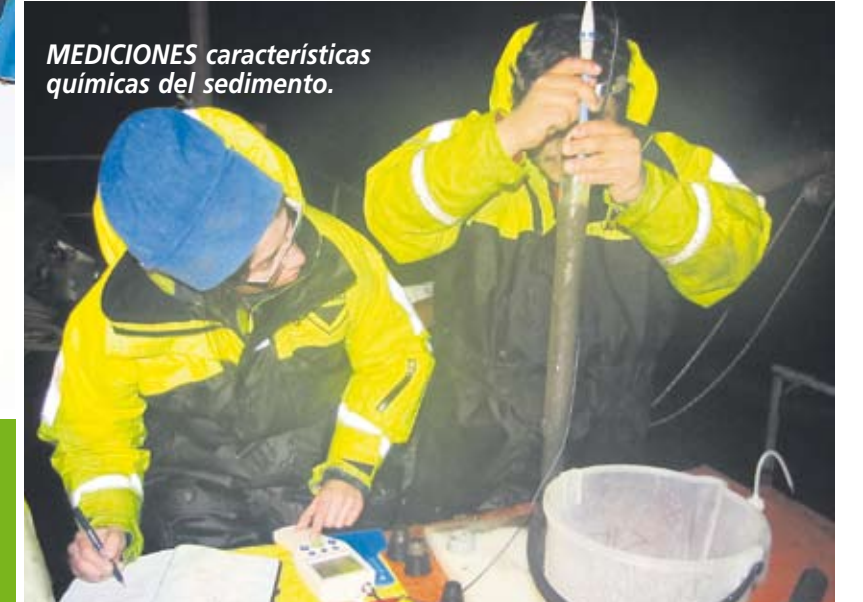
MEDICIONES características químicas del sedimento.