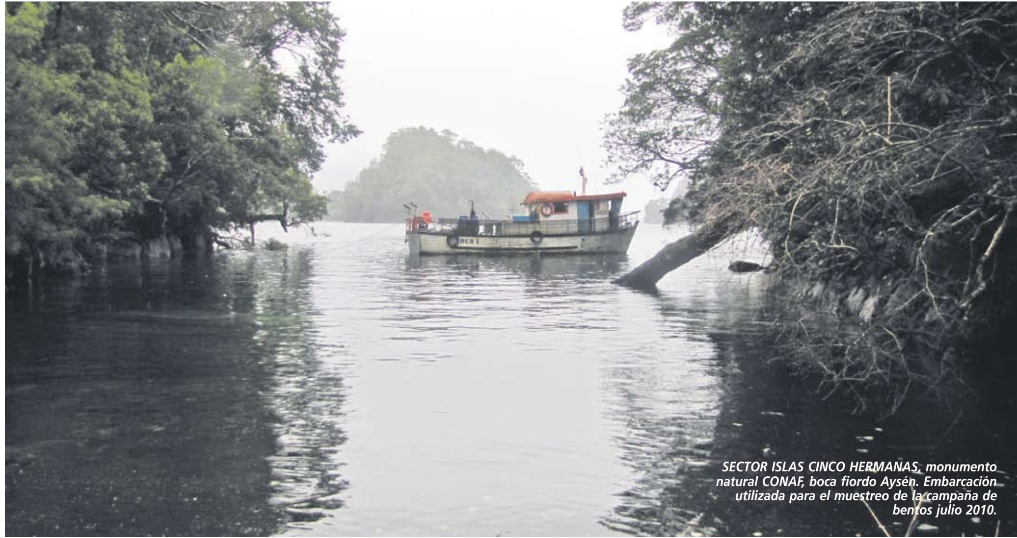
SECTOR ISLAS CINCO HERMANAS, monumento natural CONAF, boca fiordo Aysén. Embarcación utilizada para el muestreo de la campaña de bentos julio 2010.

LA INVESTIGACIÓN SE DENOMINA "ESTUDIOS OCEANOGRÁFICOS Y MODELO DE ANÁLISIS DE RIESGO PARA EL MANEJO INTEGRADO Y SUSTENTABLE DEL FIORDO AYSÉN" Y SUS RESULTADOS SE DIERON A CONOCER LOS PRIMEROS DÍAS DE ESTE MES EN LA CAPITAL DE LA REGIÓN DE AYSÉN.