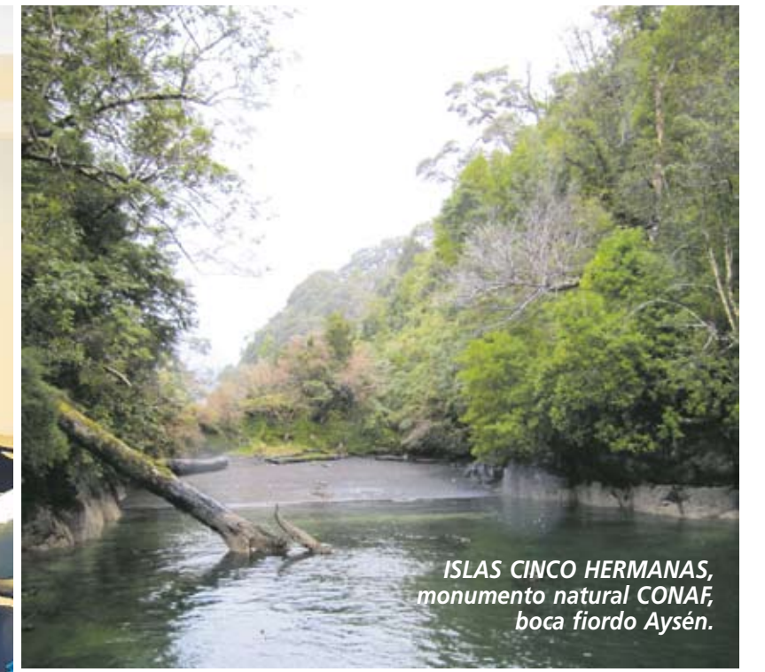
ISLAS CINCO HERMANAS, monumento natural CONAF, boca fiordo Aysén.