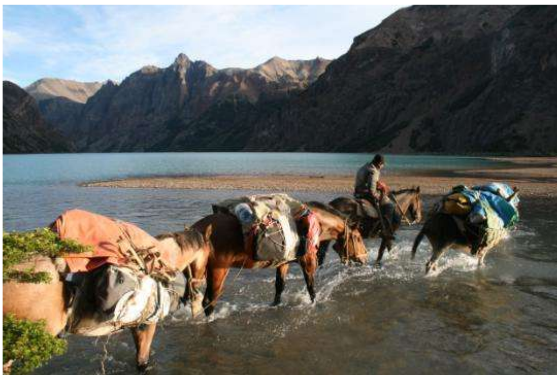
Photo 4 : Chevauchée fantastique dans le parc Jeinimeni

En Patagonie, « une autre fin du monde est possible », écrivait Franck Michel, lors d'une mission de recherche menée sur le terrain au printemps 2014. Est-ce vraiment possible ?