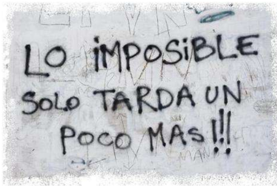
Photo 8 : « L'impossible tarde seulement un peu plus !!! », graffiti quelque part en Amérique dite latine... ( http://blog.panamajack.es/es/2011/11/07/the-impossible-just-takes-a-little-longer/ )

« Aysén Réserve de Vie » n'est sans doute pas une nouvelle utopie en Patagonie. Elle n'est pas celle d'un retour à l'état sauvage, ni celle d'une mise en réserve, ni encore véritablement la terre fertile d'une « nouvelle économie » pour philanthropes verts. Elle est seulement, mais c'est déjà beaucoup, un certain état d'esprit.