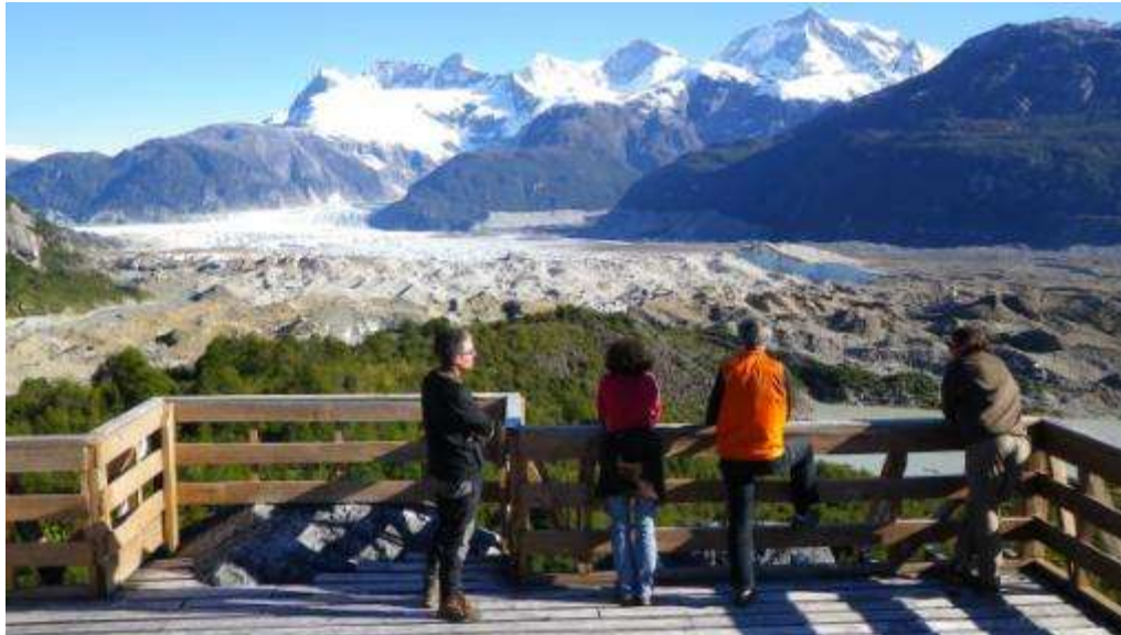
Photo 9 : Glacier dans la vallée des explorateurs, région d'Aysén, 2011

Avec mes remerciements à Patricio Segura et Nelson Huenchunir pour les illustrations du « Manual de Carreño de la Patagonia », 2014, disponible sur ISSUU : http://issuu.com/psegura/docs/manual_de_carre_o_de_la_patagonia_ays_n