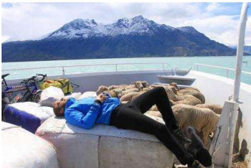
Photo 1 : Navigation sur le lac O'Higgins, région d'Aysén, 2009

« Tout cela et aussi les émerveillements que j'attendais des paysages et des vents patagoniens contribuaient à me jeter vers mon désir. »