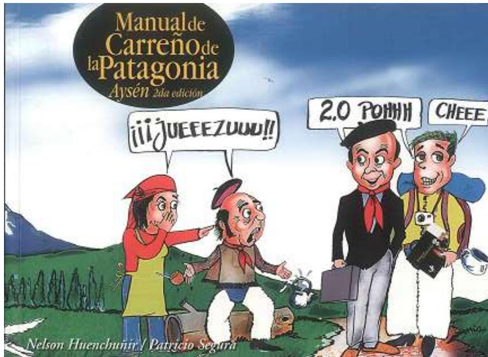
Photo 6 : Couverture du Manuel de savoir-vivre patagon (« Manual de Carreño de la Patagonia » de Segura et Huenchunir, 2014)