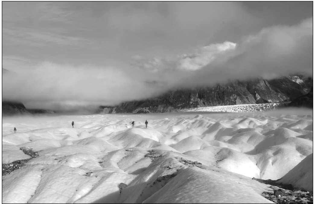
ILLUSTRATION 1 : Exploration sportive et scientifique du glacier des Exploradores au pied du Saint-Valentin (région de Aysén, Patagonie chilienne) par un groupe de guides locaux et de scientifiques franco-chiliens, reconnaissance géographique et recherche de lieux d'implantation de nouvelles stations météorologiques autonomes.

scientifique sont identifiées, définies et détaillées. Cette partie n'a pas pour prétention de référencer toutes les contributions académiques internationales utilisant la terminologie de tourisme scientifique, mais plutôt de montrer la diversité des utilisations possibles de la notion et leurs domaines d'application. La seconde partie permettra de discuter les conditions d'émergence de la notion et de sa pertinence dans les dynamiques du tourisme contemporain.