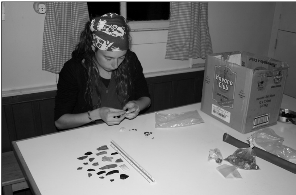
ILLUSTRATION 3 :

Éco-volontaires états-uniens et chiliens investis dans des projets archéologiques (région de Aysén) en lien avec des recherches du Muséum national d'art précolombien de Santiago, de l'Université du Montana (É.-U.) et du Centre d'Investigation sur les Écosystèmes Patagoniens, Université australe de Coyhaique, région d'Aysén. Les missions portent sur des fouilles de lieux de passage (abris sous roche) des Tehuelches, populations natives disparues et nomades chasseurs des vallées et des steppes patagones.